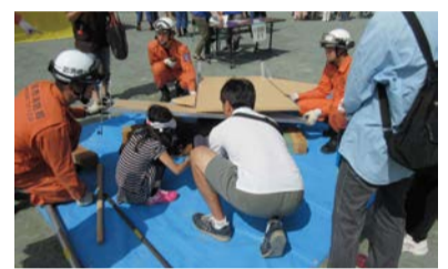
川崎市総合防災訓練(救出・救助訓練)

避難所開設・運営訓練、津波避難訓練、外国人市民を対象とした防災訓練、隣接する幸区・横浜市鶴見区と締結した包括協定に基づく連携訓練などを行います。また、区民や関係機関などと連携して地域特性に応じた区総合防災訓練を行います。