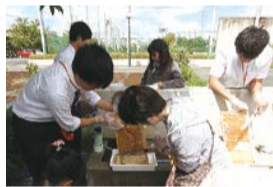
かわさきハニーフェスタでの採蜜体験

県立川崎高等学校養蜂部の活動を地域緑化の観点から支援し、養蜂活動を地域住民などに周知するために学校と連携したイベントを開催します。