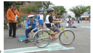
川崎市交通安全子ども自転車大会

交通事故の防止に向けて、警察などと連携した交通安全キャンペーンや幅広い世代を対象とした自転車大会・交通安全教室などを行います。