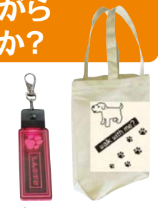
▲パトロール用品イメージ