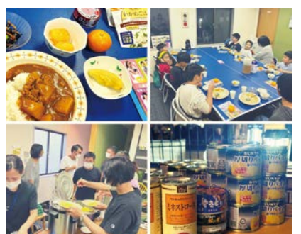
▲昨年8月・11月に開催した時の様子

ふじなかこども食堂は、病院の管理栄養士から「区内にはこども食堂が少ない。近くで利用できるこども食堂をつくりたい。」という相談を受け、区ソーシャルデザインセンターが支援し、実現した食堂です。当日の運営や食材提供など企業、地域の人たちの協力のもと開催しており、参加する子どもたちの笑顔が溢れる楽しい居場所になっています。今後の開催日時などについては富士見・中島ソーシャルデザインセンターのInstagramで確認してください。※提供できる食数には限りがあります。☎区役所企画課 ☎044-201-3267 FAX044-201-3209