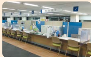
▲地域ケア推進課などは3月に7階に移転しました。

区役所と支所の窓口変更に向け、区役所のフロア構成を順次変更しています。右表のとおり、来庁時期によってフロアが異なる部署もありますのでご注意ください。移転スケジュールは、区役所内に掲示するとともに窓口でも配布します。