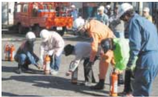
地域での防災訓練

こうした活動の中でも特に重要なのは防災訓練です。災害への備えは訓練や活動を体験してこそ、いざというときに生かされるものです。被害を少しでも小さくするために、地域の防災訓練をはじめ、自主防災組織の活動に参加してみませんか。なお、結成には、区への届け出が必要です。 ☎ 区役所危機管理担当 ☎ (201) 3327、FAX (201) 3209