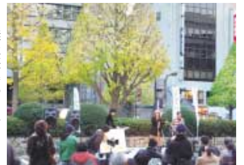
銀杏並木前でのコンサート