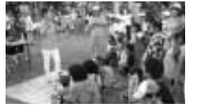
夏休みの思い出づくり