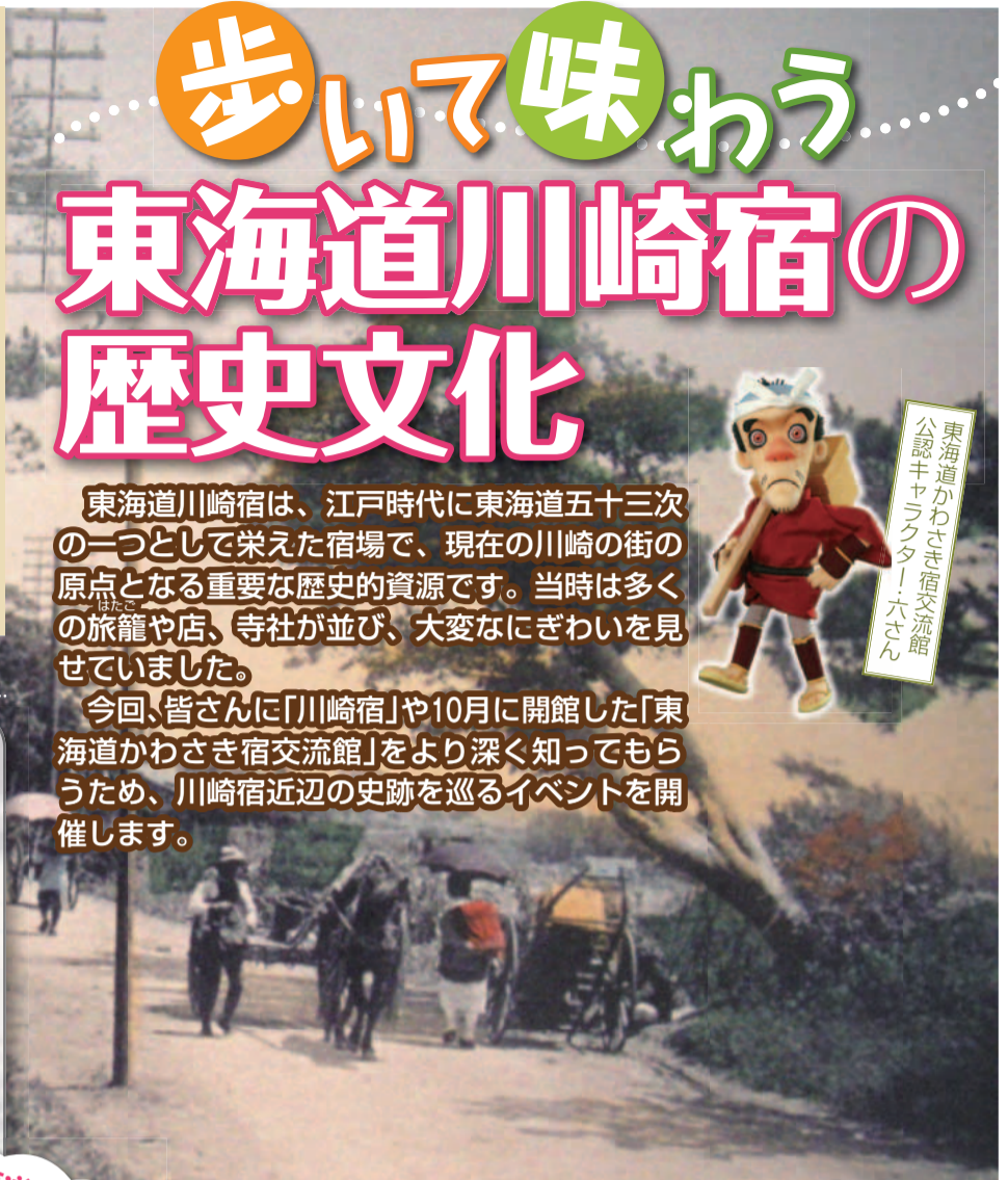
明治期・東海道川崎宿近辺