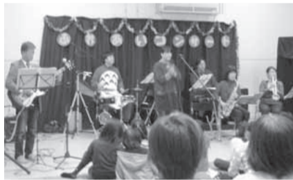
バンド演奏オリゼ

yì>†jnX"«áÒUÆ^C^-q•-iv ÔiÄ»%5`‡b{ Ôì y D ÔTÆ ì™ ì Ôt yì>M\MwH °0 yì>†jnX"«áÒw Æ^C^-ziè†¶è2z w B è 2 z µ Á " ' í Ñ ¥ " Û ï µ ç ì i Á x z ½ z X £ 冏 à p t • - ù µ ] x z FAX