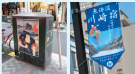
浮世絵のラッピング

東海道川崎宿の歴史・文化資源を活用したイベントの開催や、東海道沿いに浮世絵のフラッグなどを設置し、江戸風の街並みを推進します。