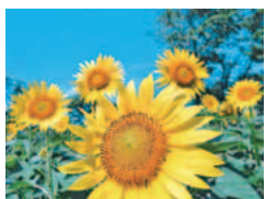
ひまわりを大きく開いた