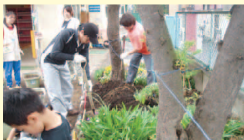
地域と一緒に緑化を進めます

離乳食講座や絵本の読み聞かせ、地域と交流を図る緑化のイベントなどを開催します。また、子育て支援者向けの講座を実施し、地域の子育て力を高めます。