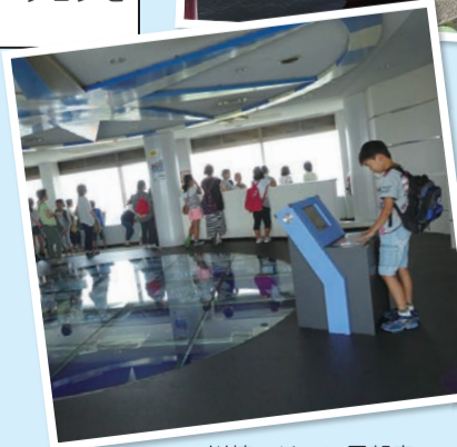
川崎マリエン展望室