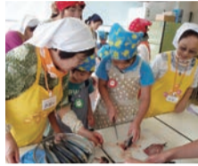
上手にできるかな

子どもと一緒に楽しく料理をしませんか。 日時 7月31日(金)、8月20日(木)、いずれも9時半～13時 場所 区役所5階栄養室 対象 区内在住の小学生と保護者各回20人 費用・持ち物 材料費、エプロン、食器を拭く布巾、三角巾 囲園7月15日から電話かFAX(氏名、子どもの学年、電話、アレルギーの有無を記入)で区役所地域保健福祉課 ☎201-3217、FAX201-3291。[先着順]