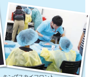
キングスカイフロント夏の科学イベント