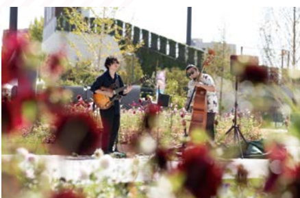
▲メインガーデンパフォーマンス

コア会場の1つである富士見公園では、最先端の緑化技術や、環境先進都市として未来につながる新しいみどりの価値を、多彩なコンテンツで発信します。