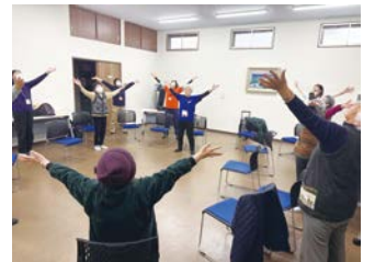
▲みんなで元気に体操