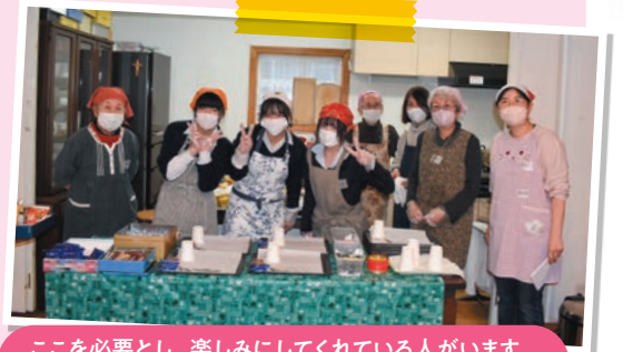
ここを必要とし、楽しみにしてくれている人がいます。そんな居場所をこれからも守り続けていきたいです。