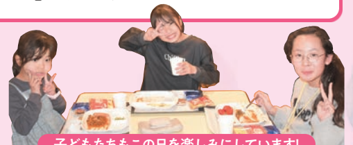
子どもたちもこの日を楽しみにしています!

定年を迎え少し時間に余裕ができたので何か始めてみようと思い参加しました。こども食堂の雰囲気を知ることができましたし、ボランティアの方の話を聞き、素晴らしい活動をされていると感じました。今後もボランティア活動に参加していきたいと思いました。