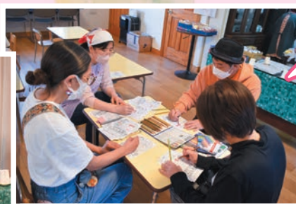
この日は新しく2人がボランティアを体験。チラシ作成の手伝いをしました