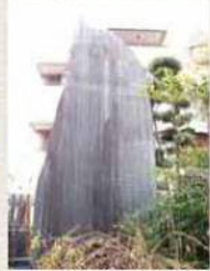
真田二重丸(妙蓮寺)小泉次 大夫と田中休庵の2人の背姿を たたえる碑。