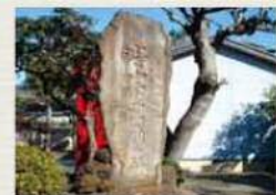
池上新田の神(沙白神社)