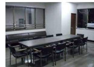
囲碁・将棋コーナー