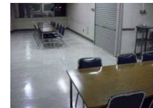
外国人市民防災訓練説明コーナー