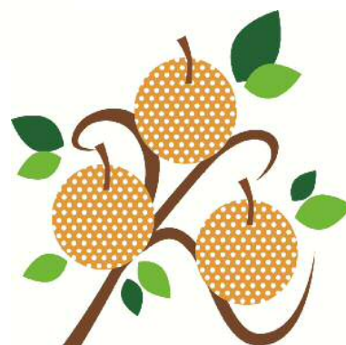
区の木 ながしやうり 長十郎梨