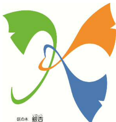
区の木 いちょう 銀杏