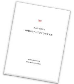
『地域防災マップづくりのすすめ(案)』

今回、『地域防災マップづくりのすすめ』を使って、大島地区で実際に災害が起きたときに役に立つものや危険なものなどを見つけ、マップに書き込んでいくという「防災まち歩き」を実施することになりました。いざという時に備えて、家族で一緒にまちを歩いて、防災について考えてみませんか。