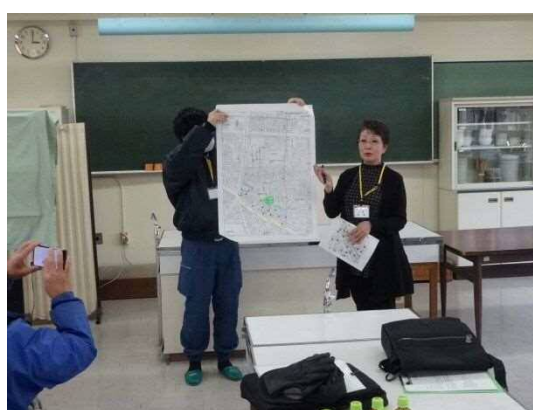
班毎にチェックした内容を発表し、意見交換を行いました。