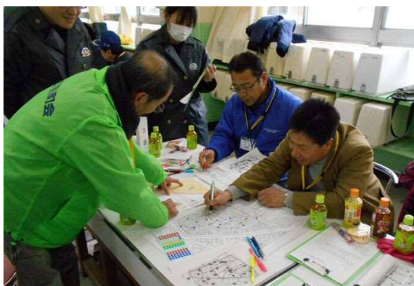
色別にチェック箇所を大きなマップにまとめます。