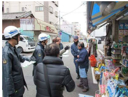
お店の方にも話を聞きました。