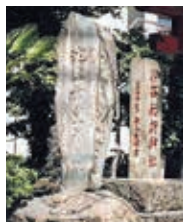
「池上幸豊翁之碑」(汐留稲荷)

汐留稲荷で祭神として祀られるとともに、功績を讃える「池上幸豊翁之碑」が建立されている。