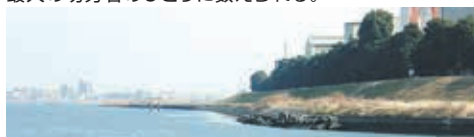
現在の多摩川下流堤防(鈴木町)

一介の農民から町人、武士、さらに三万石支配の代官職にまで立身出世を果たした異色の民政家、地方(ちかた)巧者として名高い。今日の川崎の発展の礎を築いた最大の功労者のひとりに数えられる。