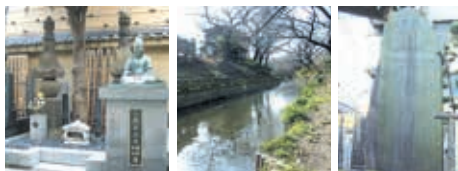
小泉次大夫夫妻の逆修塔(生前に建てられた墓)と次大夫像(川崎区妙蓮寺) 現在の二ヶ領用水(宿河原付近) 小泉次大夫と田中休愚の二人の偉業を讃え建てられた「泉田二君功徳碑」(妙蓮寺)