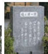
「佐藤惣之助の碑」(稲毛神社内)