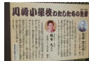
坂本九さん解説板(川崎小学校前)

特に、『上を向いて歩こう』は『スキヤキ』というタイトルで、その年のアメリカで3週連続ヒットチャート第1位を獲得、世界中で今までに2千万以上のヒットを記録した唯一の日本の名曲である。世界的に有名になった最初の日本人歌手として今も親しまれている。