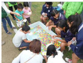
←スーパーボールすくい