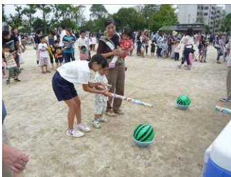
←ビーチボールすいか割り

当日は、クラブ員と京町中学校の生徒がペットボウルボウリング、スーパーボールすくい、ビーチボールすいか割り、水鉄砲射的、ストラックアウトなど毎年恒例の大人気ゲームコーナーを準備。シャボン玉コーナーやハナさんハウスによる紙芝居、地元マジシャンによるマジックコーナーも大盛況。最後には、参加者へのポップコーンプレゼントもありました。さらに京町中学校吹奏楽部のみなさんによるステージや、和太鼓の演奏など、とても賑やかな大会となりました！来年もお楽しみに♪