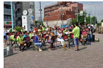
↑ オープニングコンサート