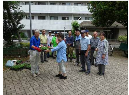
苗の提供をうける地域のみなさんへ