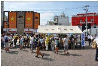
↑ ポイント「川崎大師駅」