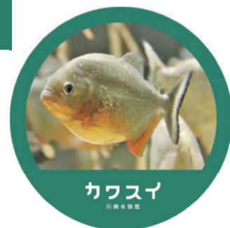
※オリジナルステッカーイメージ