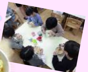
こども ニュータンメン