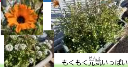
もくもく元気いっぱい

2011年に起きた東日本大震災の復興支援活動として始まった、荒れ果てた被災地に花を咲かせる活動です。小さな子どもたちや高齢者が種まきをやすく、風で飛んだり雨に流されないように種入りの泥ダンゴ作りを始めました。