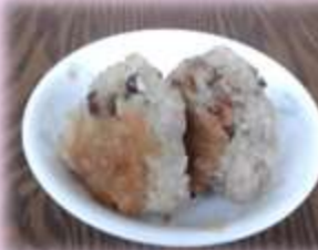
なら茶めしの焼きおにぎり