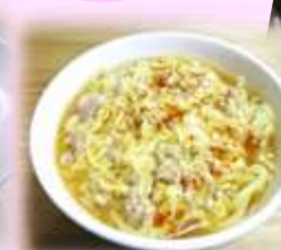
レシポが見られる二次元コードは3ページ