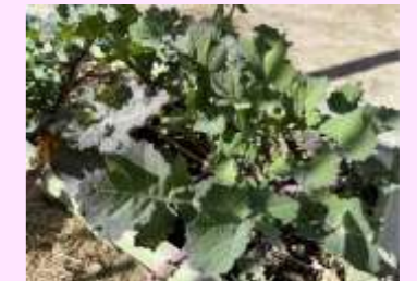
園児が栽培した川崎の伝統野菜「のらぼう菜」