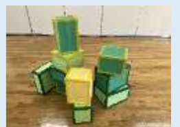
ダンボールつみき