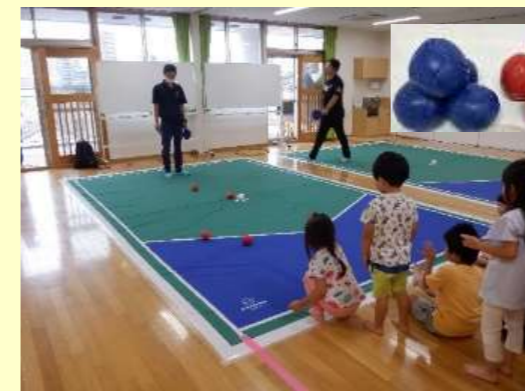
こどもでも大人でも楽しめるスポーツのポッチャ