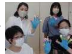
手袋シアターをつくりました

子育て支援を地域で担当している方や興味のある方対象に、手遊び等簡単実技研修を開催しています。「手遊び」や廃材を使った「手作り遊具」など、少しの時間があれば実践力が身につくものばかりです。この機会に参加者同士で交流しながら、スキルアップしてみませんか。