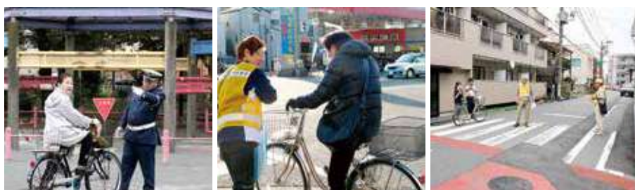
渡田新町公園で 自転車交通安全講習会開催(H29)