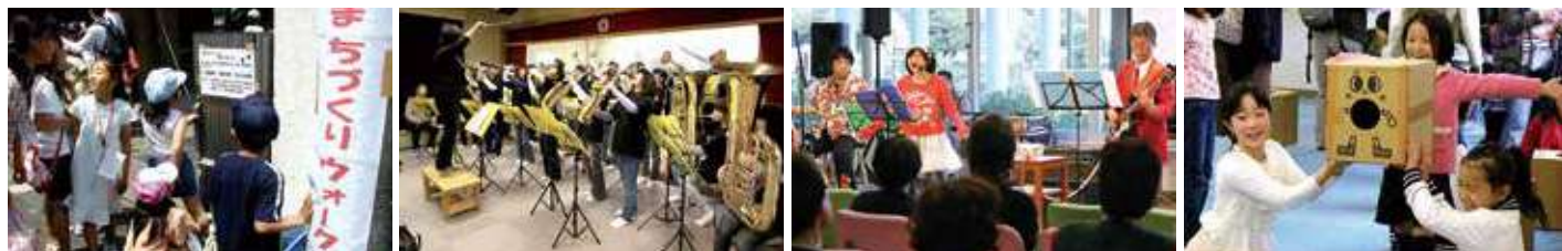
地域の名所や会館をめぐる ウォークラリー(H20)