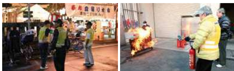
盆踊り会場を周り、 自転車の施錠状況等チェック

夏季の盆踊り会場のパトロールなど、地域の防犯・防災に関 する啓発活動、安全・安心のまちづくりに取り組んでいます。