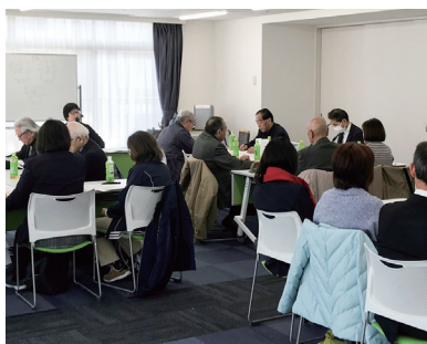
地域福祉懇談会の様子(左:大師第二地区社協 右:田島地区社協)