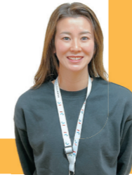
大師第4地区担当保健師

口は物を食べたり声を出して笑ったりすると、 たくさんの脳を使う ということです。