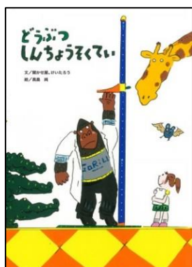
どうぶつしんちょうそくてい 文／聞かせ屋。けいたろう 絵／高島 純 アリス館

保育士さんで、『どうぶつしんちょうそくてい』『たっちだいすき』（アリス館）、『まいごのたまご』（KADOKAWA）等の絵本の文章や翻訳も手がけるけいたろうさん。20 年程前には夜の路上で絵本を読んでいた聞かせ屋さん、どんな風に果実を実らせたのか、楽しくお話して頂きましょう。