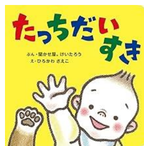
たっちだいすき ぶん・聞かせ屋。けいたろう え・ひろかわさえこ アリス館