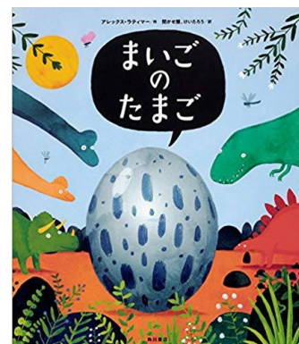
まいごのたまご アレックス・ラティマー／作 聞かせ屋。けいたろう／訳 KADOKAWA