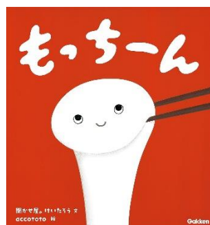
もっちーん 聞かせ屋。けいたろう／文 accototo／絵 Gakken