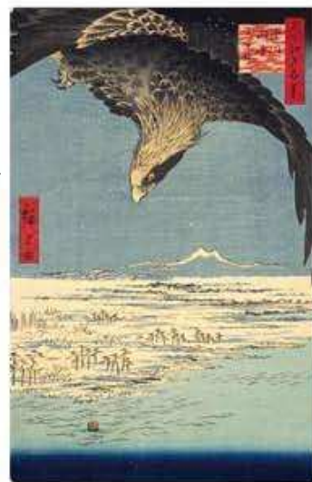
歌川広重「名所江戸百景 深川洲崎十萬坪」