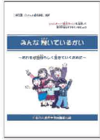
「みんな輝いているかい」 (高学年むけ)