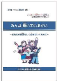
「みんな輝いているかい」 (高学年むけ)