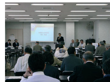
昨年度のフォーラム

各年度末には、それまでの審議や取組の経過を、より広く区民に周知し、区民の声を聴くための区民会議フォーラムを開催します。