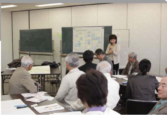
8人前後のグループに分かれて、ディスカッションし、その結果をお互いに発表しあいました。