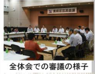
全体会での審議の様子