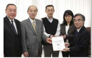
区長に提案を提出