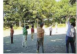
区民会議提案をきっかけに区内に広がっている”公園体操”