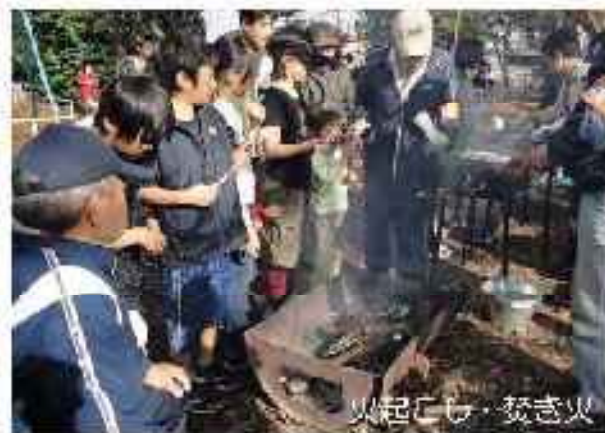
火起こし・焚き火