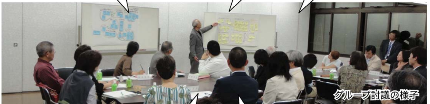
グループ討議の様子