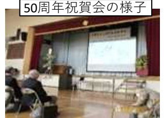
50周年祝賀会の様子

令和4年5月28日に、「創立50周年」に入りました。記念誌を作成し、祝賀会を行い、地域の行政、学校、自治会、各種団体のリーダー、多数ご参加いただき、にぎやかに祝うことができました。