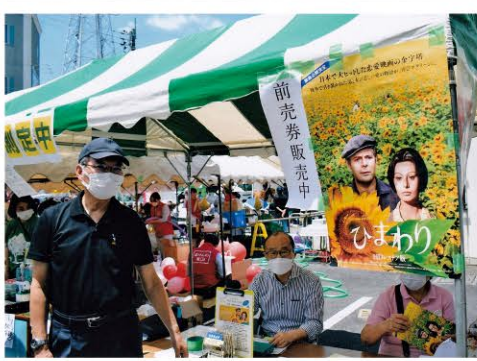
鷺沼駅前コインパーキング(まちフェス会場) 地図J-8

まちづくり活動賞 3年振りの鷺沼の祭。まだまだ制限のある中で、フェス開催できた。ウクライナの状況は変わらず、マスクも外せず。そんな中、待ちに待った賑やかな祭の日。