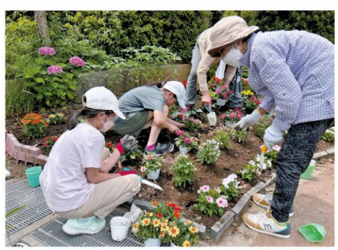
菅生3丁目 菅生第4公園 地図F-4

川崎市公園緑地協会賞 子どもたちで花壇の手入れをするようになって何年になるかな。毎日気にかけての水やりや、雑草取りも楽しい。