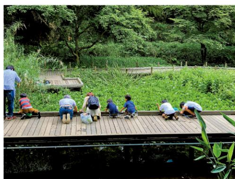
東高根森林公園 地図M-2

区制40周年記念賞 環境保護は必要で、家族と一緒にいる時間は貴重だと思います。宮前の自然と環境保護のおかげで、みんなが幸せな時間を過ごすことができるのです。