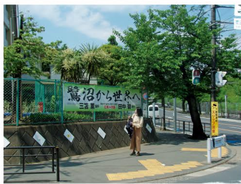
宮前区鷺沼2丁目 鷺沼小学校 角 地図I-8

まちづくり活動賞 メッセージ賞 サッカーワールドカップで、鷺沼が生んだ三苦・田中選手が大活躍。彼らに続くよう、後輩達へ夢と希望に満ちたメッセージが掲示され注目されています。