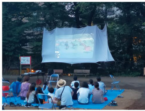
土橋2丁目公園 地図J-6

宮前区文化協会会長賞 夏の公園でこんなイベントあったら...宮前区に住みたくなっちゃいます!!身近な公園で、夕暮れから行うイベント、こどもの冒険心を掻き立てます!