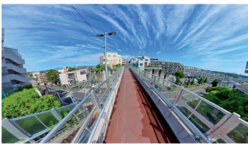
ふるさと南平橋東詰 地図I-5

審査委員長特別賞 長く分断されていた稜線の王禅寺道。ふるさと南平橋が完成し、ふたたび繋がりました。