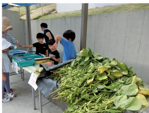
馬絹1丁目 農家の畑 地図M-8

メッセージ賞 ぼくのおじさんは農家で直売所をしています。小さい頃から手伝っています。直売所は農業の喜び以外にも接客も売り方も考えて学べる学校だと思います。