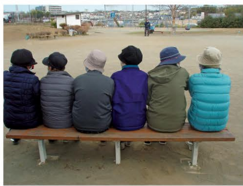
宮前区東有馬5丁目 東有馬植木の里公園 地図N-10

ふるさとみやま賞 高齢者のサークル活動の合間のひと休み。趣味の話、旅行の話、グルメの話...話題は尽きない。ストレス発散の場でもある。