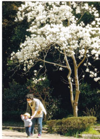
東高根森林公園 地図M-2

川崎市公園緑地協会賞 いつもより少し遅く春が来た。ハクモクレン、コブシ、サクラ...と春の花のラッシュが続く。