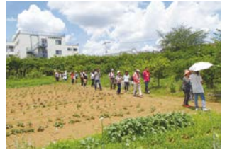
ウォーキングの様子

宮前区にある農家を、農マップを活用しながら巡ります。今回は鷺沼・有馬方面の農家を訪問し、普段聞けないお話を伺います。