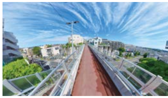
第18回審査委員長特別賞 「ふるさと南平橋」と王禅寺道」

区の魅力を内外にアピールすることを目的としたフォトコンテストを開催します。撮影技術以上に写真の内容やメッセージ性を重視します。入賞作品は区民祭当日に表彰式を行うほか、全ての応募作品を宮前市民館市民ギャラリーで展示します。