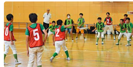
昨年度の大会の様子