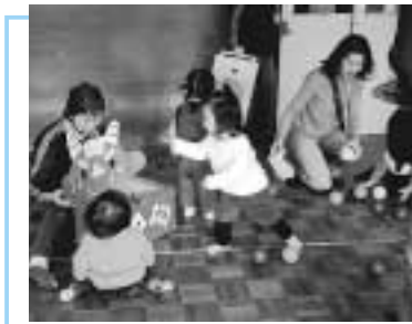
元気いっぱい遊ぶ子どもたち

区では、認知症予防について学ぶ講演会を開催します。二年目となる今回は、質・量ともにパワーアップし、三回の講座として開催します。 認知症とはどういう病気なのか、どのような予防が可能なのか、この機会に学んでみませんか。一回のみの参加も可能ですので、気軽にご参加ください。