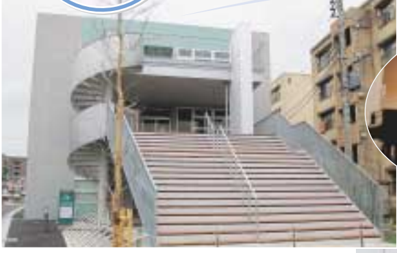
階段だけでなくエレベーターも