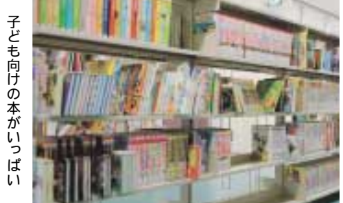
子ども向けの本がいっぱい