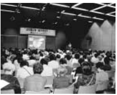
大盛況だった昨年の講演会

な生活習慣を身に付けてみませんか。 日時 六月五日(金)午後一時半～三時半 場所 区保健所一階集団教育ホール 定員 三十人 内容 メタボリック症候群