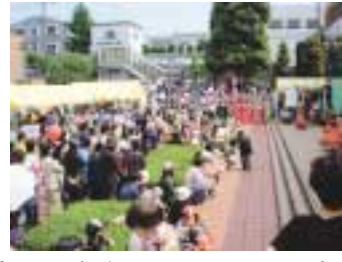
毎年多くの人でにぎわいます

当日は家庭で不用になった古着類を回収しますので、お持ちください。 受付・回収時間 午前10時～午後3時 回収するもの 衣類、シャツ、ハンカチ、ネクタイ、着物、靴下など 汚れているもの、破れているものは回収できません 区宮前生活環境事業所 ☎866-9131、FAX857-7045