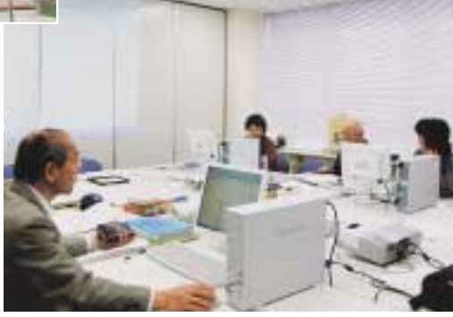
打ち合わせや会議にも

五月十八日(月) 新たな学びと市民活動の拠点となる「有馬・野川生涯学習支援施設」がオープンします。