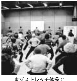
まずストレッチ体操で

メタボリック症候群とは 内臓脂肪による肥満の人が高血糖や高血圧といった生活習慣病になる危険因子を併せ持っている状態のことです。 区では、メタボリック症候群予防のためのセミナーを開催します。話題になっているメタボ。若い世代の脂質異常も増えてきます。メタボ予防のためには、食事のこつを学んで健康的