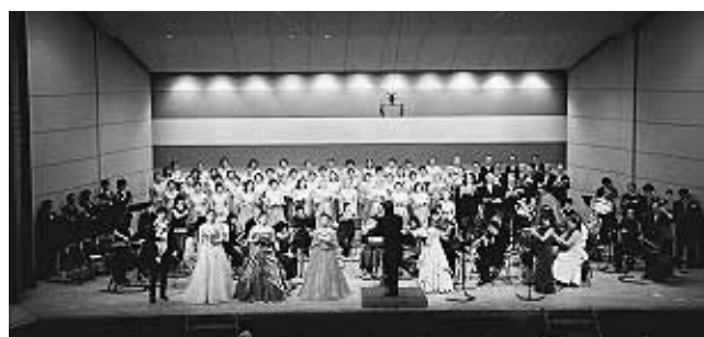
素晴らしい音色を響かせます

クラシックの名曲で新春を華やかに飾る、手づくりのコンサートを一緒につくり上げませんか。応募資格 原則十八歳以上でクラシック音楽を演奏す