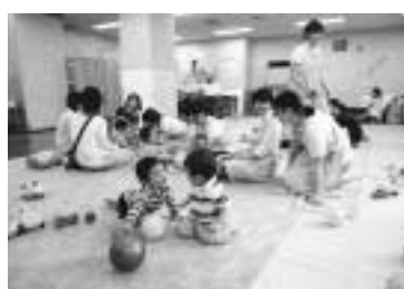
毎回たくさんの参加者が集まります

所の一階で開催しています。事前の申し込みは不要、自由に参加できます。子どもたちと遊んでいるうちに、自然に保護者同士の交流も生まれます。妊娠中の人の参加も大歓迎。地域のつながりが生まれ、出産や子育ての情報交換ができます。スタッフは「カンガルー」の会員。参加者と同じ立場の人たちが活動しています。ほかに、区内六カ所のこども文化センターで開催しています。