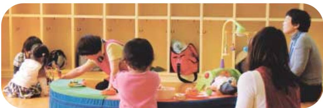
お友達と一緒に遊べます

五月二十五日(月)、旧南野川小学校校付属幼稚園を利用した、新たな子ども・子育て支援施設「 こどもサポート南野川 」がオープンしました。