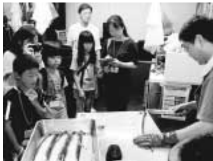
ウナギをさばく様子を見学

市場を見学しながら、食について考えます。8月4日(火)野菜編、8月6日(木)魚編。8時～14時。区内在住の小学1～4年生と保護者各回30人。教材費400円。7月5日(必着)までに、希望日、住所、全員の氏名、年齢(学校・学年)、電話番号を記入し往復ハガキで。[抽選]