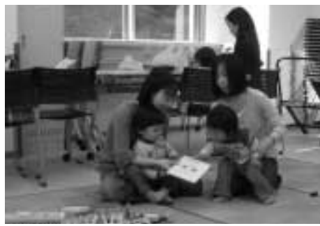
新しい友達ができるかな