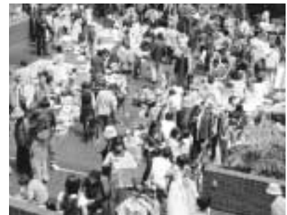
掘り出し物が見つかるかも

川崎西部地域療育センターがオープン 旧向丘診療所跡地に川崎西部地域療育センターがオープンしました。地域療育センターでは、子どもの成長や発達についての相談を受け、情報の提供や診療、子どもに合わせた療育支援を行います。利用を希望する人は、まず電話でご相談ください。