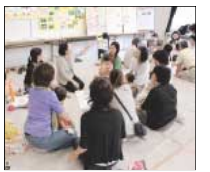
「同じ地域の人の話を聞けてよかった」という声も

区内に引っ越してきて間もない親子を対象にうえるかむクラスを開催します。子育てグループや民生委員などと交流しながら、子育て仲間を見つけたり、公園、買い物スポットなど、生活に密着した情報を交換できます。 日時・場所 下表参照 住んでいる地域によって異なります 対象 ことし区内に転入してきた、おおむね3歳以下の子どもと保護者 定員 各回70人 開期 4月15日午前10時から 電話で宮前市民館 ☎888-3911、☎856-1436。[先着順]