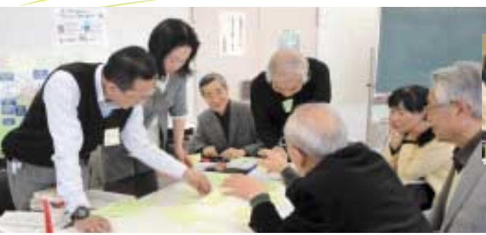
フォーラムで話し合う委員と会議の様子(右)