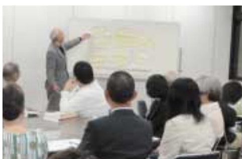
地域参加につながる情報発信を目指します

昨年五月にスタートした第三期区民会議が中間報告をまとめました。 第三期では、宮前区らしさ・地域特性を生かしたコミュニティづくりに取り組んでいます。 地域社会をより良くするために、多くの住民がコミュニケーションの担い手にな