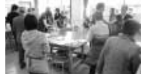
活発な意見交換が行われます

まちづくり広場ラフみやまえ 二月十八日(土)に「まちづくり広場ラフみやまえ」を開催します。このイベント内で市民活動団体の交流を目的として、ポスターセッション参加団体を募集します。活動内容を紹介します。活動内容を展示するポスターを展示し、活動状況や成果を来場者と語り、情報交換をしてみませんか。対象 区内で市民活動をしている三十団体