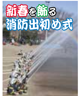
新春を飾る消防出初め式 新春恒例の消防出初め式を開催します。消防署、消防団などによる合同演技のほか、幼年消防クラブの踊りなどが行われます。 日時 一月十四日(土)午前 十時~十一時半 場所 消防総合訓練場(宮前区犬蔵1の10の2) 宮前消防署(852)