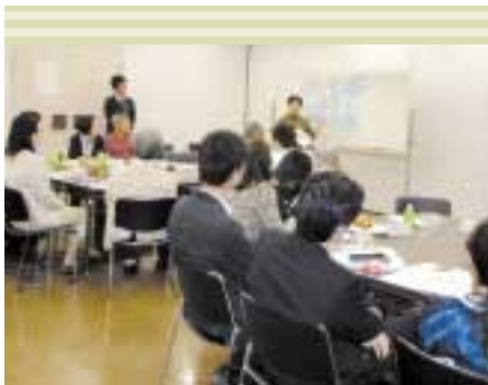
区民会議での活発な意見交換