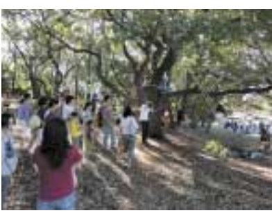
「自分の責任で自由に遊ぶ」が信条の冒険遊び場

有馬・東有馬地区では、地元協議会が主体となつて、一月二十三日、二月十七日までの平日(土・休日は運休)にコミュニティバスの運行実験を行うことになりました。