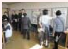
ポスターセッションでの活発な意見交換

区役所地域振興課(区まちづくり協議会事務局) ☎856-3125、FAX856-3119