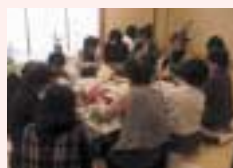
フラワーアレンジメントなどの体験が楽しめます