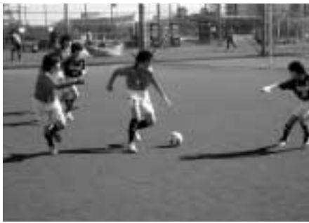
初めてでも楽しめます

ジュニアフットサル大会 みやまえスポーツふえす ていばる実行委員会では、 ことしも小学生のフットサ ル大会を開催します。 日時 三月九日(土)午前九 時～午後一時 雨天中止 場所 フロントタウンさぎぬ ま(土橋3の1の1) 対象 区内在住の小学五・ 六年生で構成する十六チー