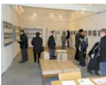
応募作品が並ぶフォトコンテスト展示会

ことしは「まちづくり広場ラブみやまえ」と「大人の文化祭inみやまえ」を同日開催します。市民団体などが集まって、日ごろの活動紹介などを行います。ぜひ宮前市民館へお越しください。