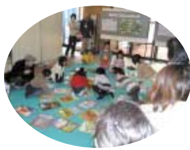
みやまえカルタ「こどもジャンボカルタ大会」

ンボカルタ大会、川崎宿名物料理の奈良茶飯が入った弥次喜多弁当(有料)、C級グルメの紹介、クイズラリー