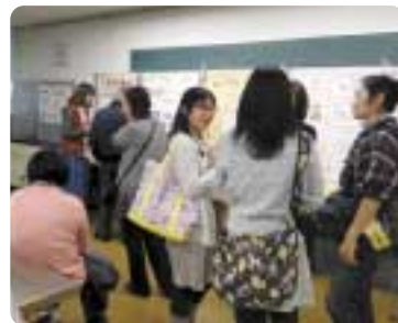
情報交換や交流もできるポスターセッション