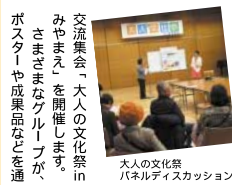
大人の文化祭 パネルディスカッション

交流集会「大人の文化祭inみやまえ」を開催します。さまざまなグループが、ポスターや成果品などを通して活動を紹介します。フ 日時 二月十六日(土)午後一時～四時 場所 宮前市民館大会議室 他 宮前市民館 ☎(888)3911、FAX (856)1436