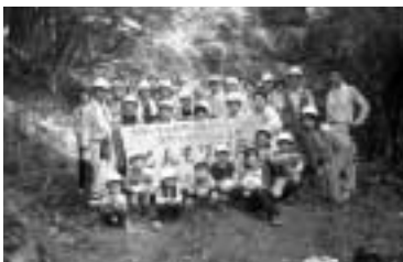
夏休みの思い出づくりに

囲 6月17日から申込用紙を直接、区役所地域振興課 ☎856-3135、☎856-3280。[先着順] 申込用紙は区役所で配布中