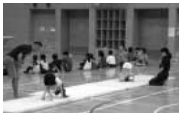
苦手な種目を克服しませんか

囲 7月8日(必着)までに往復ハガキに氏名とふりがな、学年、住所、電話番号を記入し〒216-0011犬蔵1-10-3宮前スポーツセンター ☎976-6350、☎976-6358。[抽選]