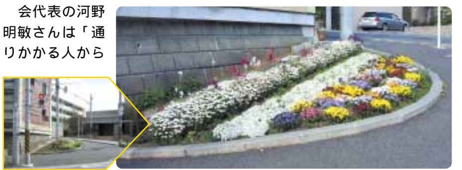
信号待ちも楽しくなりそうです