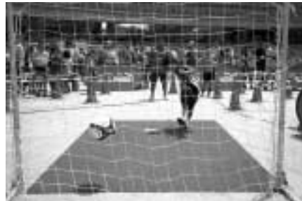
シュートスピードも測定できます 20m走測定やシュートチャレンジなどに挑戦しませんか。