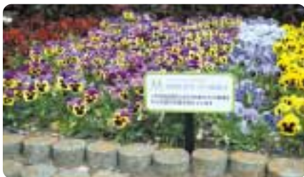
パンジーがきれいに咲きました

ことしも20団体程度に提供を予定しています。一緒に花いっぱいの宮前区にしませんか。