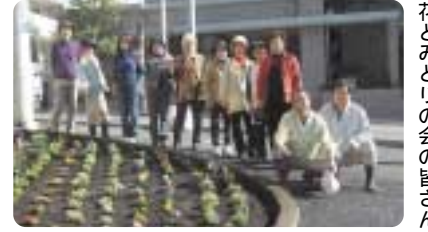
花とみどりの会の皆さん

『きれいに咲いたね』と声を掛けられたり、苗を提供してくれる話をされたり、地域のコミュニケーションが生まれるのがとてもうれしい」と話してくれました。