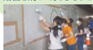
昨年の落書き消し

区役所では、市民団体「落書き戦隊ケスンジャー」と一緒に落書き消しを行い、地域の住環境を守る支援を行っています。ことしは7月28日(日)9時から、東名神木公園(神木本町2-1)で実施します。