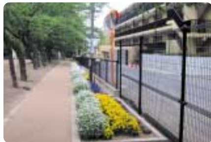
木々と花と道路が調和しています

提供時期は10月28日～11月29日。花苗の種類・色の指定はできません。支援決定団体は9月30日に開催する「花とみどりの支援説明会」に参加してください。