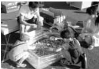
スーパーボールつり

フロントタウンのホームページ(☎ http://www.fronttown.com )をご覧ください。ただ、直接お問い合わせください。