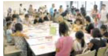
昔あそびコーナー