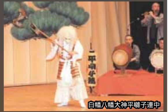
白幡八幡大神平離子連中

心に響く太鼓の音、神秘的に揺らめくかがり火、息をのむ美しさのねぶた ---。ことしも宮前に、“暑い夏”がやってきます。