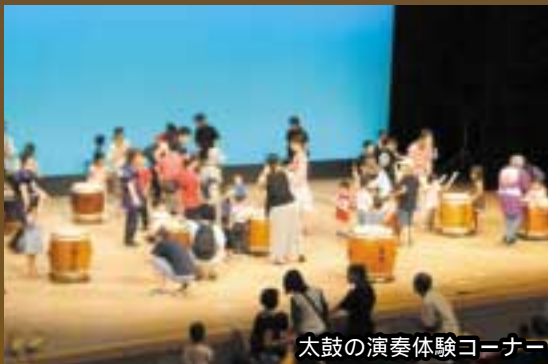
太鼓の演奏体験コーナー

みやまえ太鼓ミーティング開催当日に浴衣で来場、または持参すると、無料で着付けやお直しが受けられます。11時~16時、宮前市民館2階グループ室で。直接お越しください。