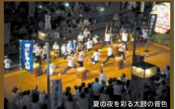
夏の夜を彩る太鼓の音色