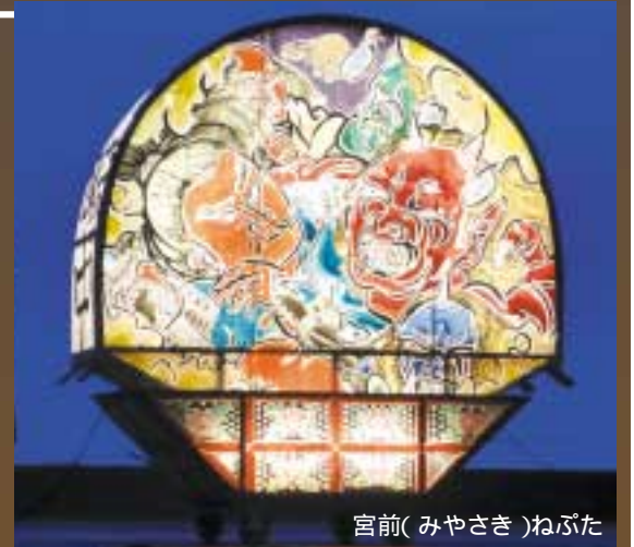
宮前(みやさき)ねぶた