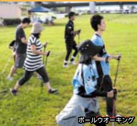
ボールウォーキング

2本のボール(ストック)を使って全身の筋肉を動かす「ボールウォーキング」で、等々力陸上競技場まで歩いて、サッカーを観戦するツアーを開催します。