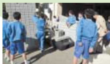
仮設トイレ設置訓練 宮前平中学校の

この季節は多くの地域で防災訓練が実施されます。小・中学校を会場に、消火訓練や避難所開設訓練を行っているところもあります。皆さんも地域で行われる訓練に参加して、いざというときに備えましょう。