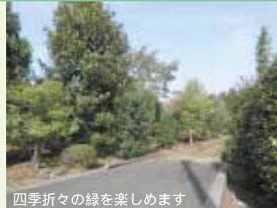
四季折々の緑を楽しめます

囲読9月17日(消印有効)までに往復ハガキに「植木の里めぐり」、参加希望日、郵便番号、住所、氏名(ふりがな)、年齢、電話・ファクス番号を記入し〒216-8570宮前区役所地域振興課(区観光協会事務局) ☎856-3135、☎856-3280。[抽選]