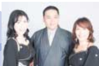
ももたらう(アカペラ)

日時 10月25日(金)12時5分～12時45分 場所 区役所2階ロビー 曲目 ふじの山、赤い鳥小鳥、かなりや他 区役所地域振興課 ☎856-3125、FAX856-3280